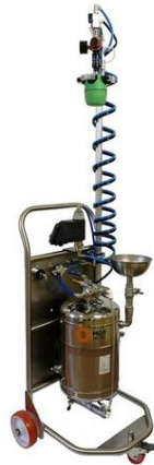
За малки помещения и офиси