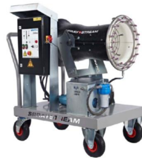
За големи помещения и производства