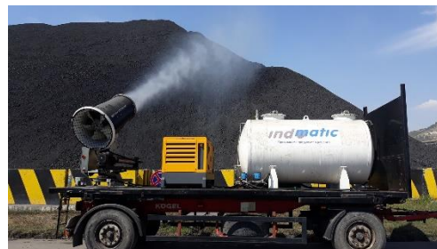
За открити площи